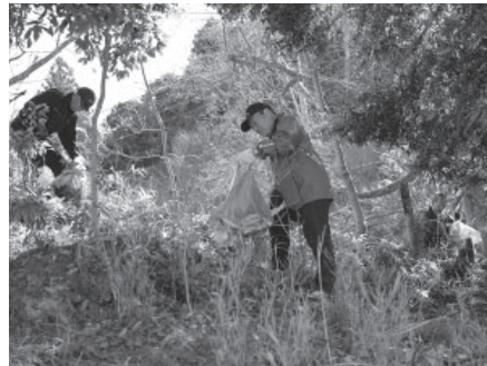
↑ごみを拾う参加者。170kgのごみが集まりました

3月15日、添田町・みやこ町・行橋市・赤村で構成する今川流域市町村連絡協議会の主催で油木ダム周辺の美化活動が行われました。活動には津野地域の皆さんや各市町村の環境団体、ヤマト運輸のボランティアなど100人以上が参加。ダムの周辺に捨てられた空き缶やペットボトルなどを1時間にわたって拾い集めました。