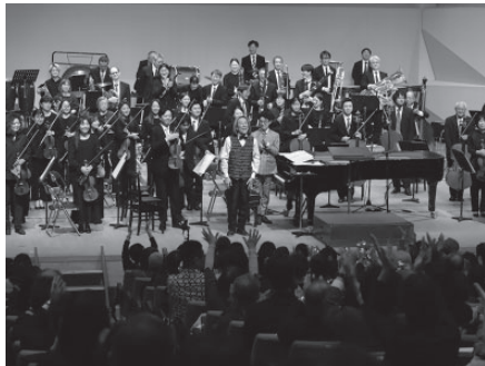
↑圧巻の演奏にスタンディングオベーションに包まれた会場

オークホールで3月1日、日田彦山線沿線の地域振興や移住定住促進を目的としたコンサートが開かれました。3人の作曲家が添田町と東峰村に滞在して