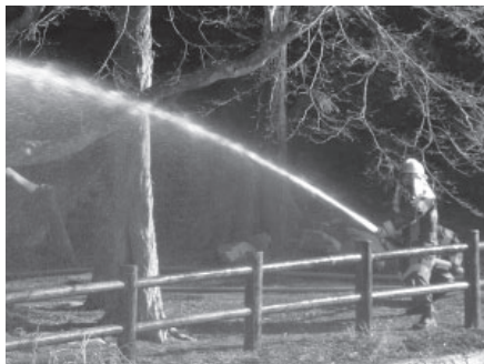
↑5月頃まで空気が乾燥します。火のもとに十分注意を

3月1日からの春の火災予防運動の一環として、1日に添田公園横にある添田小中学校付近での林野火災を想定した火災防ぎょ訓練が行われました。訓練