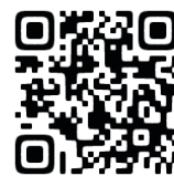
コワーキングスペースサイト