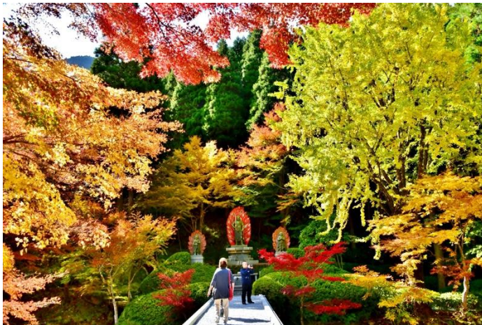
毎年多くの観光客でにぎわう紅葉