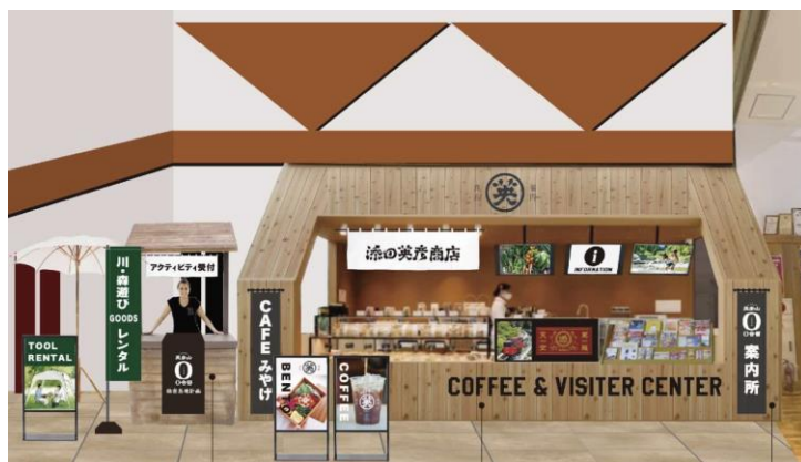
ビジターセンター完成イメージ

カフェを運営したり、イベントを企画したり、SNS で魅力を発信したり。添田町を訪れた誰かが「また来たいな」と思えるような体験や空気感を、一緒につくってくれる方をお待ちしています。