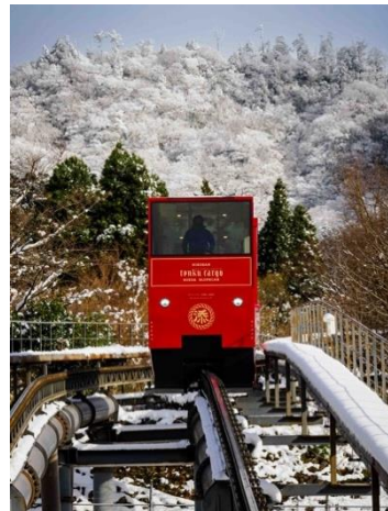
英彦山神宮までのスロープカー