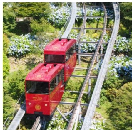
リニューアルされたスロープカー