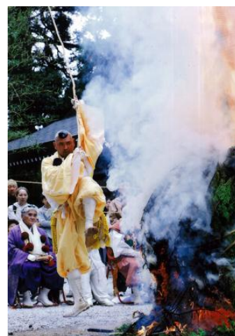
高千穂禰宜による護摩焚

地域に寄り添い、英彦山の新たな魅力とともに育んでくださるあなたのチャレンジを、心よりお待ちしております！