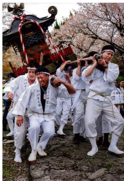
毎年4月に行われる「神幸祭」