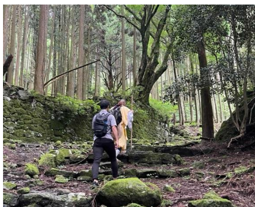
既存修験道体験ツアーの様子